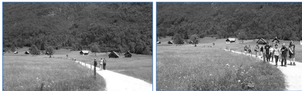
Prišli, videli, pojedli vinderšnice, odšli – ZMAGALI!

Edini neodvisni dnevnik na šoli v naravi